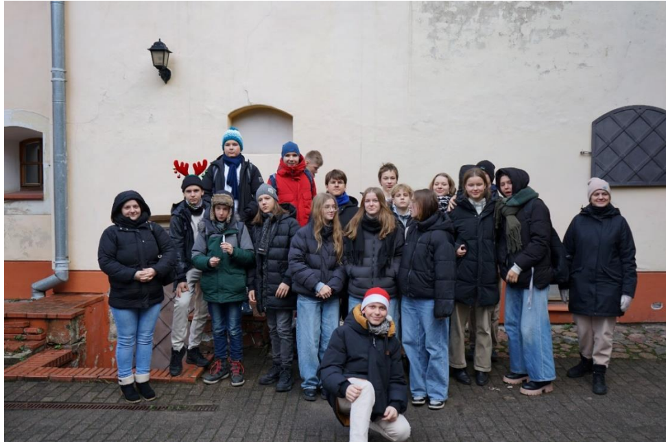
VšĮ „Saulės gojus“ pagrindinės mokyklos moksleiviai

vyresnių klasių moksleiviams, kurios vyko Paveldo komisijos būstinėje, 1 paskaitą Vilniaus universiteto paveldosaugos studijų studentams, sudalyvavo Lietuvos radijo ir televizijos laidoje „Ryto Alegro“ ir „Labas rytas“. Taip pat šios temos aktualizavimas paskatino rašyti pranešimus ir kitus besidominčius šia tema (detali informacija IV skiltyje).