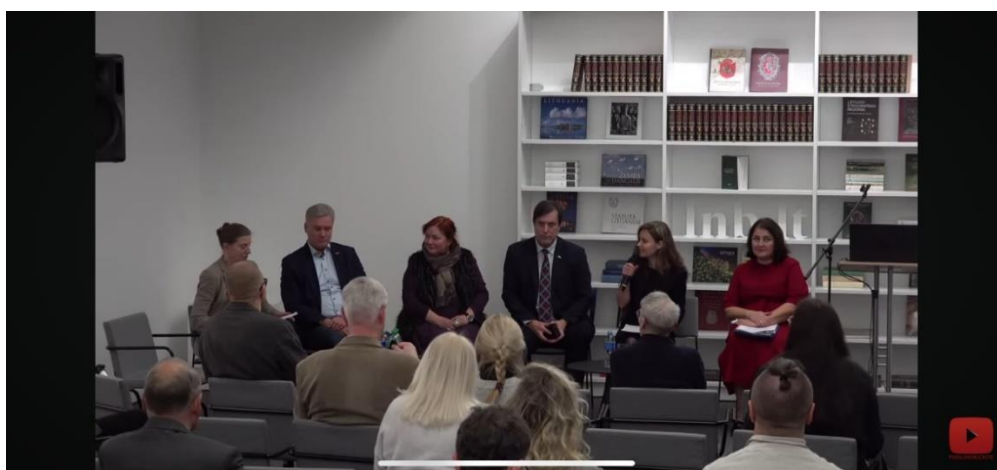
Renginio diskusijos dalyviai

Renginio diskusijos dalyje dalyvavo pagrindinių kultūros paveldo politiką formuojančių įstaigų atstovai. Į renginį atvyko daugiau kaip 50 kviestinių dalyvių, tiesiogiai per nuotolį dalyvavo lietuvių diasporos atstovai iš JAV, vyko tiesioginė transliacija YouTube kanale. Renginio metu ir po renginio peržiūrų skaičius – virš 450.