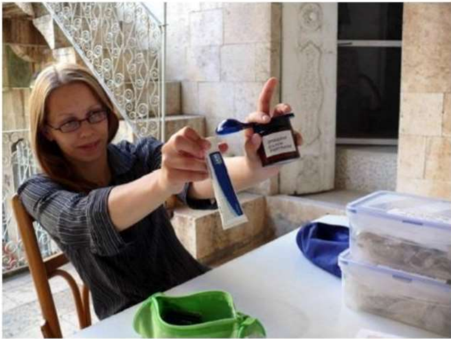
Picture 6: Everything you need to make silicone rubber moulds of cuneiform tablets