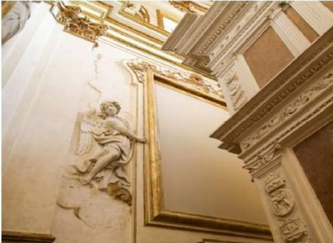
21_After – Celestino V chapel after the restoration and the discovery of the original golden baroque decorations. In some areas are still visible cracks and disconnections of the masonry because it was not possible eliminate the deformations.