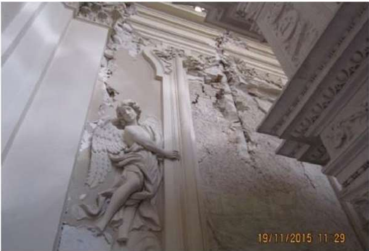
20_Before – Celestino V chapel. The earthquake caused serious damage to the decorative stucco work, like cracks, defective adhesion and hundreds of fragments found in the collapse area, but affected also the floor, with its alarming displacement.

„Prieš“ ir „po“ nuotraukų pavyzdžiai (su antraštėmis) paraiškos dokumentacijoje: